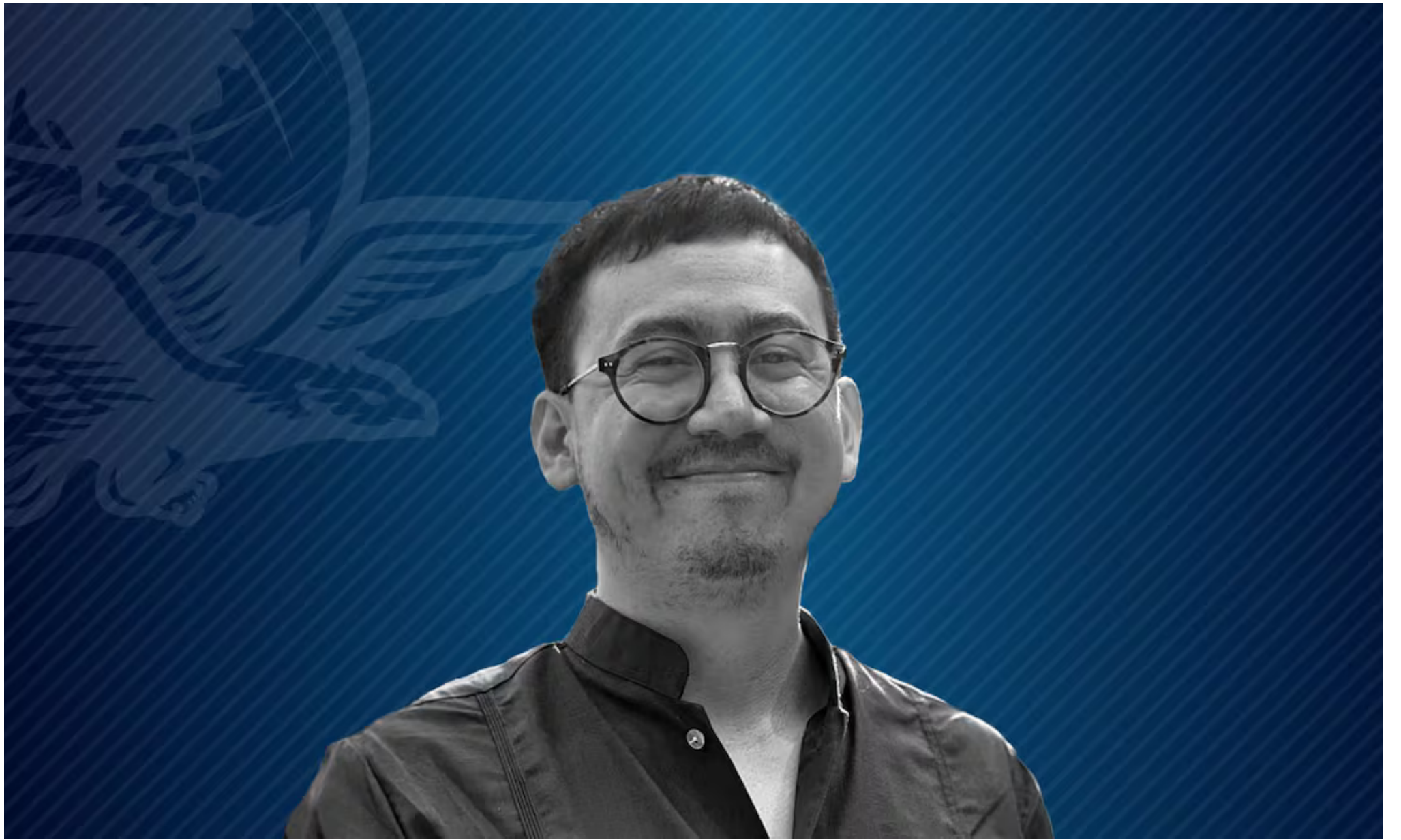
Máximo Jaramillo, autor de Opinión.

Se viene la regulación al trabajo en plataformas digitales. Aunque genera ganancias multimillonarias, sus condiciones de trabajo son precarias. Es necesario reconocer su relación laboral con empresas