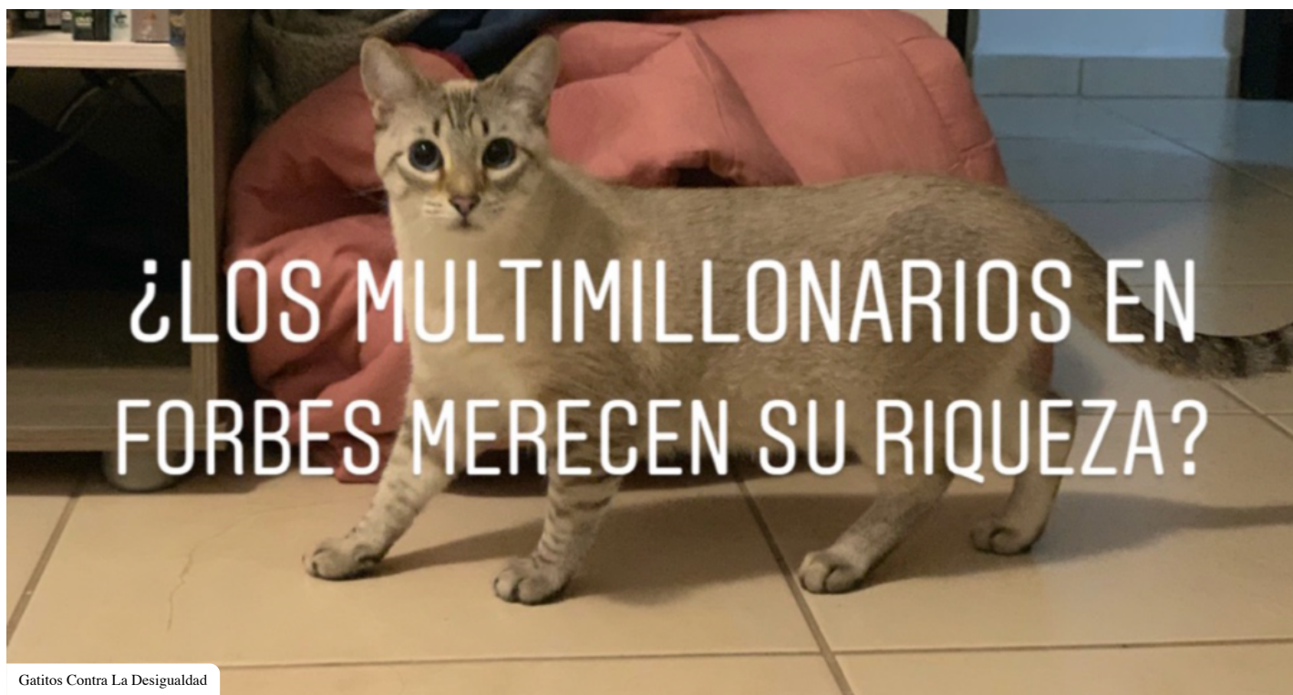
Gatitos Contra La Desigualdad